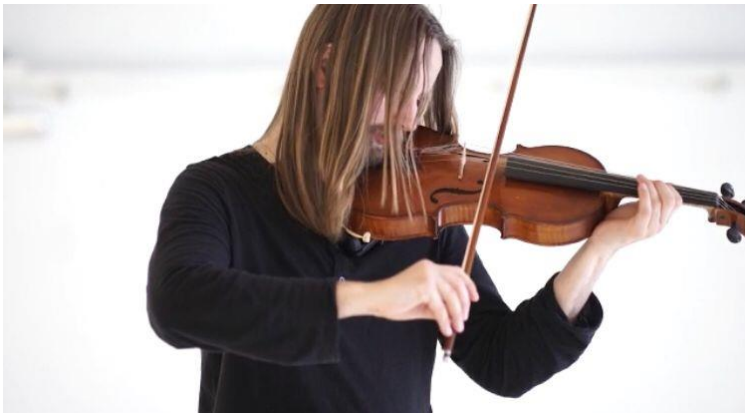
TIMOTEO CARBONE Musicista e Compositore